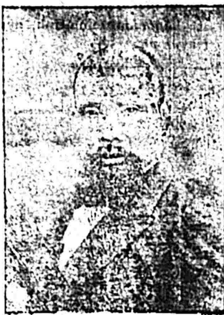
Ảnh cụ Phan-Bội-Châu

Có phụ thêm các bài diễn-thuyết, nhiều văn thơ của Cụ lúc ở nhà và ở ngoài-quốc như: Hải ngoại huyết thư, kính khoa danh, kính quốc nhân, v. v. lại có mấy bài cụ