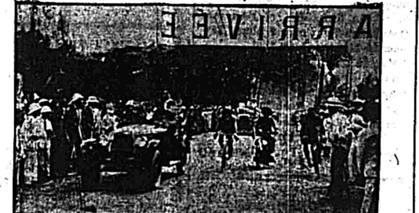
Lúc về tới mức ăn thua

Đua xe máy khó nhứt là nước nạp. Bởi vì mới phát chạy dồng người lộn xộn, xe kếm khó vững, lại thêm sức lực hãy còn khoẻ mạnh nên hết thấy dều khum lưng chạy bất kó sống chết. Chạy như bay. Có nhiều người chịu không nổi nước nạp phải rút lại sau, ngó tới tập dẫu thấy đi xa, bắt thời chỉ mà bỏ cuộc. Chớ nếu mình chịu nổi nước nạp rỏi, chừng 10 ngàn thước,