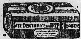
PÂTE OU SAVON DENTIFRICE